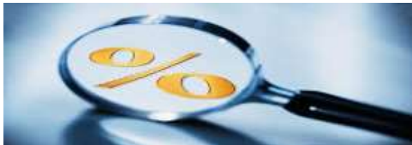
TASA DE RECARGOS 2015

En cuestión de recargos por pago de impuestos federales, a partir del 1 de enero del próximo año se mantiene la tasa de recargos por prórroga de 0.75% mensual sobre saldos insolutos, por lo que la tasa máxima de recargos mensual para el caso de mora será del 1.125%, la cual deberá redondearse al 1.13% de conformidad con las disposiciones del Código Fiscal.