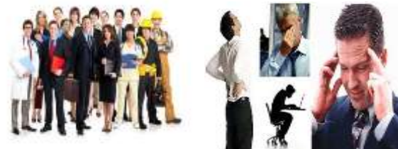
REGLAMENTO FEDERAL DE SEGURIDAD Y SALUD EN EL TRABAJO