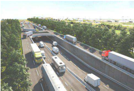
No existen infraestructura ni las condiciones de seguridad necesarias para el paro cada cinco horas estipulado por la SCT.

La Confederación Nacional de Transportistas Mexicanos (Conatram) anunció que no acatará la disposición de la modificación a la NOM 087, emitida por la Secretaría de Comunicaciones y Transportes (SCT), que estipula el paro de unidades después de cinco horas de viaje para que el chofer descanse 30 minutos, debido a que no existen infraestructura ni las condiciones de seguridad necesarias.