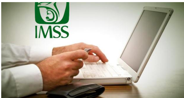
“MI PENSIÓN DIGITAL”

“Por el momento no es posible continuar con tu Proyección de Pensión debido a: La información con la que cuenta el Instituto indica que no eres candidato para obtener una pensión. Si deseas